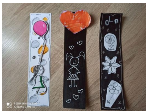
Aleksandra Chowańska, lat 4 Gr. „Krasnale”