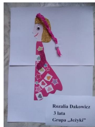
Rozalia Dakowicz, lat 3 Gr. „Jeżyki”