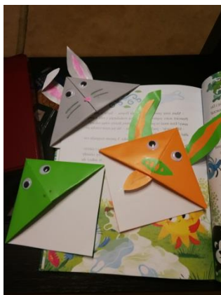
Aleksandra Gołko, lat 4 Gr. „Krasnale”