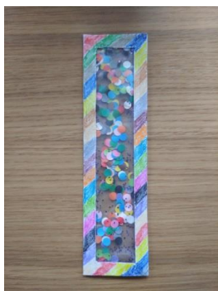
Laura Sawicka, lat 4 Gr. „Krasnale”